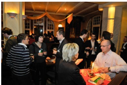
Gründer-und Unternehmertreff im Rahmen der 9. UNIVATIONS-Gründerakademie

Termin: 02. Juni, ab 19.00 Uhr Ort: Hallesche Bar Lujah, Kleine Ulrichstraße 36, 06108 Halle