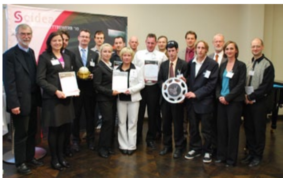
Preisträger des Scidea-Ideenwettbewerbs 2010, Sponsoren, Partner und Organisatoren.

Eine Expertenjury kürte am 22. April zum Abschluss des Scidea-Ideenwettbewerbs 2010 fünf kreative Ideengeber aus der Wissenschaft. Die Studenten und Absolventen der Martin-Luther-Universität Halle-Wittenberg, der Burg Giebichenstein Hochschule für Kunst und Design Halle sowie der Hochschule Anhalt wurden mit Preisgeldern im Wert von 2.250 Euro prämiert, zudem wurde der Sonderpreis „Forscher“ im Wert von 1.000 Euro sowie der Publikumspreis, dotiert mit 250 Euro, verliehen. Bei der Jury-Bewertung standen nicht das Gründungspotential, sondern das Entwicklungspotential und die Möglichkeit der